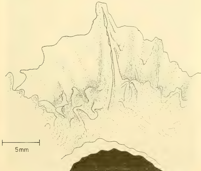
Abb. 1: Pterynotus brianbaileyi , Schulterstachel